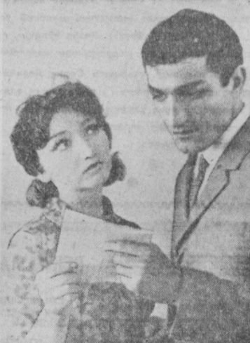
Эзувчи Фарҳод Мусаёнов ўз ҳикоялари билан китобхоналарга таниш. Унинг қатор ҳикоя китоблари эълон қилинган.