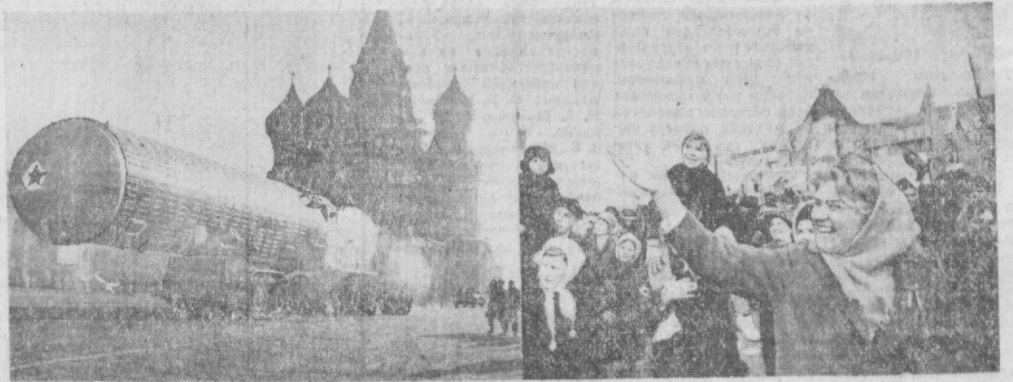
Улуғ Октябр Социалистик революциясининг 49 йиллиги. Москвада байрам қилиниш. СУРАТЛАРДА: 1. Москва гарнизони кўшиқларининг пароди. Қизил майдондан контейнерга солинган ракетга қарши урувчи даҳшатли қурол ўтмоқда. Бундай қурол билан ҳар қандай масофадан туриб агрессорнинг баллистик ракетасини яқсон қилиш мумкин. 2. Мехнатқилар вакилларининг.