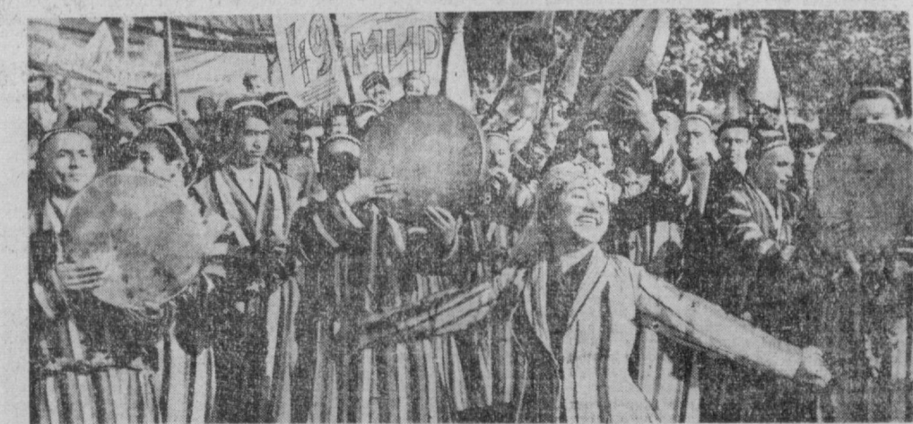
Тошкент мехнатқилар вакилларининг намоиши.