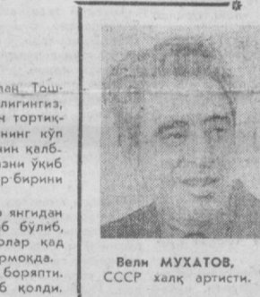
Вели МУХАТОВ, СССР халқ артисти.

30 йилдан ортиқ вақт ўтди. Бугунги кунда мен сўзга Ўзбекистонни кўриш шарафига муяссар бўляман. Ёзувчи Тошкентнинг диққатга сазовор жойлари билан танишган, бугун Фарғонага йўл олди. Шундан кейин у Бухоро, Самарқанд, Қўнон шаҳарларига борди. Фучик қаҳрамонлари билан суҳбатлашди. Ёзувчи ўз саёхати натижақасида «Улуғ ипак йўли» деган китоб ёзишга киришмоқда.