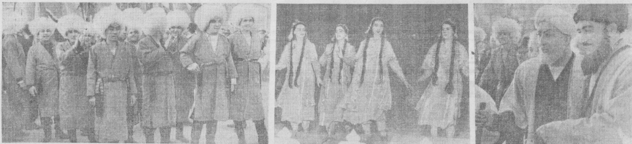
Туркманiston адабиёти ва санъати декадаси давом этмоқда. Суратларда: 1. Туркман чавандоз йиғитлари. 2. Давлат халқ ракс ансамблининг хотин-қизлар группаси «Қорақум қанали» рақси ижро этмоқда. 3. Улуғ мутафаккир ва маърифатпарвар Алишер Навоий (СССР халқ артисти Олим Хўжаев) шоир Маҳтумқули (СССР халқ артисти Омон Қўлмамедов)ни табриқламоқда.