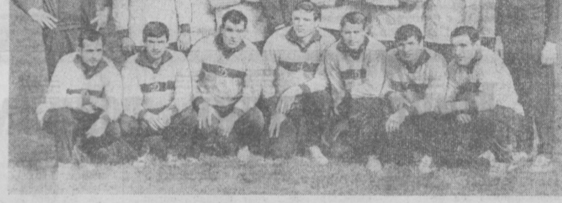
Суратда: футбол бўйича 1966 йилги СССР чемпиони унвонини кўла киритган Киевнинг «Динамо» коллективи.

гимназияга эмас, чет элларда ҳам қатта иштирок қилган. Хамжиҳатан ҳам бундай хамжиҳатан ва коллектив руҳида ўйнайдиган футболчилар билан фахрланмас керак.