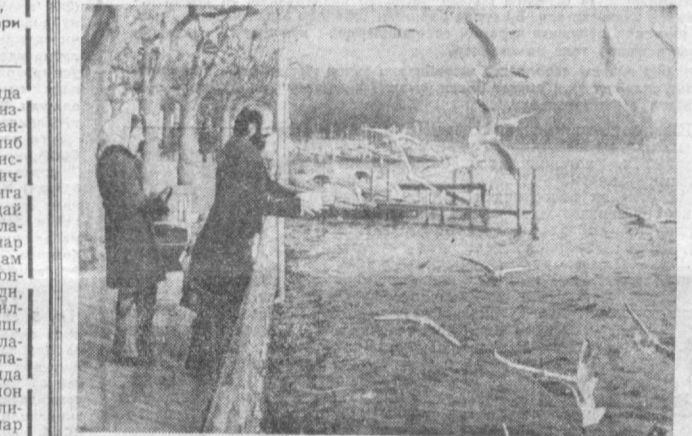
ШВЕЙЦАРИЯ. Ички тоғ оралиғида, Цюрих кўли мамамлакатининг йирик шаҳри — Цюрих жойлашган. Чукур ва хўшманзара сув ҳавзаси. Ички буйида кўплаб чорбоғлар барпоқилган.