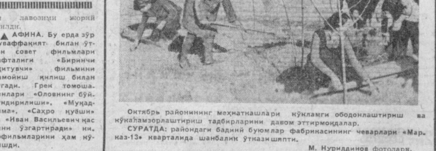
Октябрь районининг меҳнатнашлари кўнлағи ободонлаштириш ва кўнамазорлаштириш тадбирларини давом эттирмоқдалар.

Утган кунин Тошкентда беш олимларнинг санъат масалалари бўйича илмий-назарий конференцияси очилди.