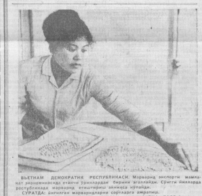
Вьетнам демократик республикаси. Марварид экспорти мамлакат экономикасида етацик уриллардан бирини эгаллади. Сўнгги йилларда республикада марварид етиштириш айнаса кўпайди. СУРАТДА: ирилган марваридларни суртларга ажратиш.