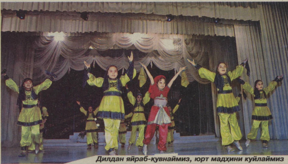
Дилдан яйраб-қувнаймиз, юрт мадҳини куйлаймиз

Мамлакатимизда Президентимиз Ислам Каримов раҳнамолигида ёш авлодни ҳар томонлама баркамол инсонлар этиб вояга етказишнинг муҳим воситаларидан бири сифатида спортни ривожлантириш, ёшлар ўртасида соғлом турмуш тарзини тарғиб қилиш ва шу эзгу мақсад йўлида барча шарт-шароитни яратишга доимий эътибор қаратилмоқда.