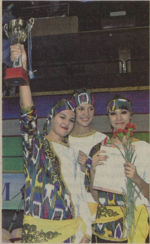
Муваффақиятларимиз давомий бўлсин

Тинч-осойишта ҳаёт кечиримизда маҳалланинг ўрни катта. Бугунги кунда ўзини ўзи бошқариш органи мақоми остида фаолият юритаётган маҳаллаларимиз аҳолининг ижтимоий, иқтисодий, маданий манфаатларини таъминлаш борасида кўлами кенг ишларни амалга ошириб келаётгани барчамизга яхши маълум.