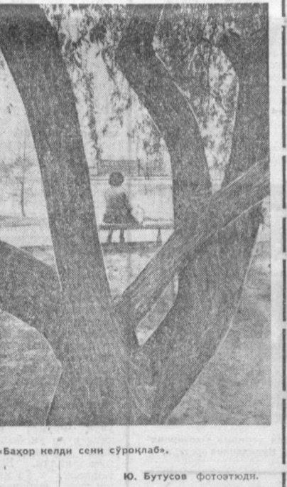
«Баҳор келди сени сўроқлаб».

Ушбу шунинг (ондунум) насалиги ва зараркунадалардан барг ўрочи менахур курт ҳосилини кескин намойиштириш, тоқтунинг ривожланишини сусайтириб юбориш сабаби бўлади.