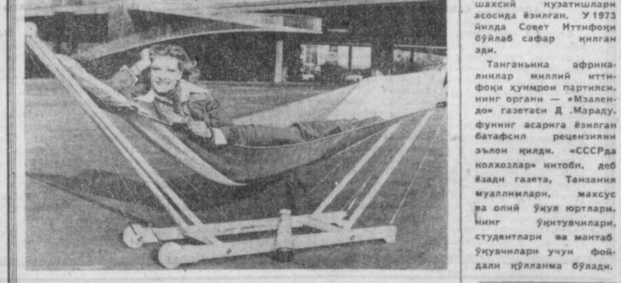
Безинг иссиқ кунларида салқин ўрмонда дам олиш, осма наравотда чўзилми, мириқиб хордиқ чикаришга нима етсин! Аммо шаҳар ичиде бўлсангиз, нима қилиш керак! Фарбий германиялик ихтирочилар бунинг ҳам йўлини топишди. Сиз сурагда кўриб турган беланчасимон осма наравот Кёльн шаҳридаги халқаро мебель кўргазмасида намойиш қилинди.

Бир кун кечаси Франциянинг Вильнёве шаҳридаги Лемулар оғиласининг ўғилдан даҳшатли қичқирлар эшитилди. Бир эркак овози ёрдамга чақирарди. Чошиб келган қўн-қўшни ўғрини қатий ушлаб олиб, уни беаёс савала