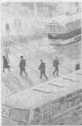
жуда кам, бошқа маршрутларда эса ана шу вақтларда йуловчилар жуда кўпчилиги ташкил қилади.

Лекин шунга қарамадан шаҳримизда йуловчиларни шаҳар транспортидан фойдаланиши ҳамон ёмон аҳволда. Бунинг айрим сабаблари шундаки, транспорт қатновини ташкил этишда камчиликларга йўл қўйиш билан бирга, графика аниқ амал қилмасликлар. Шунингдек кўпчилик йуловчилар транспортлардан тўғри фойдаланиш қоидаларини билдирмайди. Йуловчилар оқими қисқа вақтларда ўзгариб туриши мумкин. Баъзан шундай ҳоллар ҳам бўладики баъзи бир маршрутларда йуловчилар