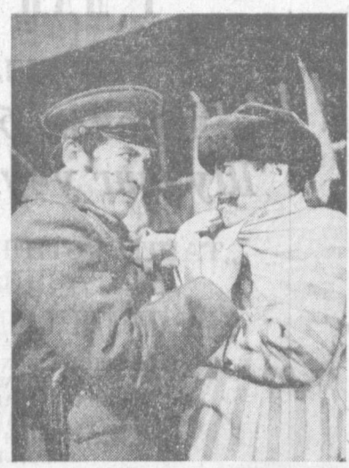
Республика «Еш гвардия» драма театри коллективини янгида томошакорларга янги спектакль туғфа этди...