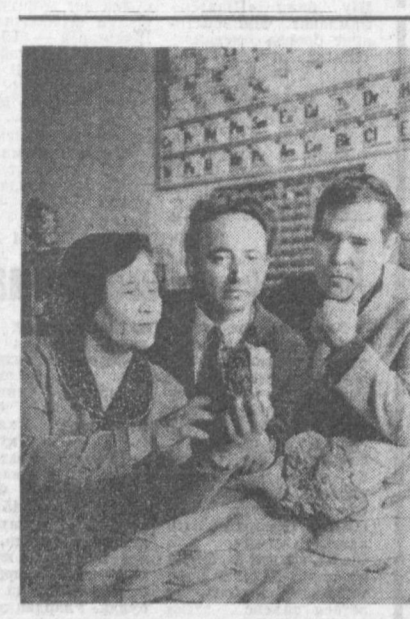
«Ташкентгеология» трестда мон қидирувчи мутахассислар меҳнат қилишдади. Кошталар республикамиз территориясида йўллаб янги хазиналар макони қидириб топилмоқда.

Томсклик рессом Владимир Марьяниннинг 55 та иши Копенгагенда нашр этилган «Европа экслибристи»нинг библиографиясига киритилди. 58 график Европадаги энг яхши мастерлар тўғрисида ҳикоя қиладиган йиллик нашрда биринчи марта ўз асарлари билан қатнашмоқда.