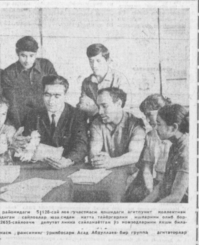
Шажримнинг Киров районидagi 5128-сai лoв участкaси қoшдaги агитпункт коллектив

«Хамма сайловга» «Ўзбекистон ССР ва республика Компартиясининг 50 йиллигини муносиб кутиб олайлик». «Совет сайлов системаси жаҳонда энг демократик сайлов системасидир» каби ширлар, порлаб, турбди.