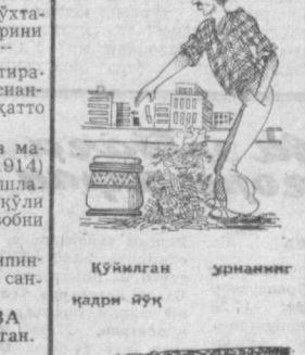
Қўйилган умрининг қадри йўқ

◆ Неаполитанлик Армини тўхтамасдан Дантенинг 157,350 шеърини ёдан ўқий оларди. ◆ Гамбеттанинг ҳам ажойиб хотираси бор эди. У Виктор Гюго ва Оссианининг ҳамма асарларини сўзма-сўз, ҳатто тескари тартибда ўқий оларди. ◆ Махшур Америка философи ва математиги Чарльз Саидерс (1839—1914) инкала кўлини шу қадар яхши ишлатардики, бир вақтингизда бир қўли билан саволин, бир қўли билан жаюбин ёзарди. ◆ Энг катта каламушлар Филлиппида яшайди, уларнинг узунлиги 80 сантиметргача боради. М. АЪЛАМОВА тўлаган.