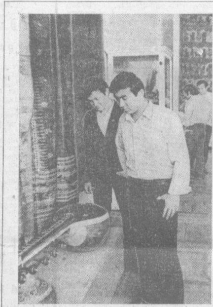
Кунинча неча ишга тушган ўзбекистон санъат музейи залларидан бирида янги бўлим — ҳинд маданияти бўлими ташкил қилинди. Бу бўлим ҳинд халқининг кўп қиррали маданияти ва санъати билан аниқдан таништирди. СУРАТДА: Томошабинлар ҳинд миллий асосби саторни кўздан кечирмоқдалар.