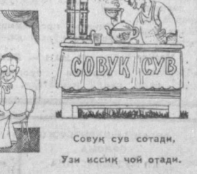
Энди дилсиздин... С. Емгирчиев расмлари.

ГАЛАТИ ОВ Норвегиянинг Глом —Фьордлик балиқчи-лари энг-заманли тўр сувдан чиқариб олишганда ҳайратлан ёна ушлаб қолишди. Турнинг ичи очилганда, консерва қилинган португал сардилари чиқди. Балиқчиларнинг денгиздан овлаган балиқларини сотишга ҳақлари бўлса ҳам, денгизда «сузиб юрган» консерва балиқларини сотишга ҳақлари йўқ экан. «Вокруг света» дат.