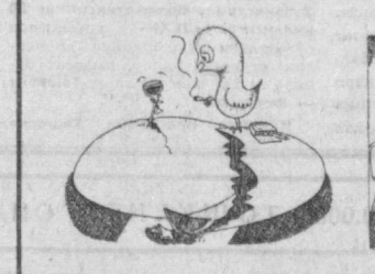
Изоҳнинг ҳоқати йўқ.