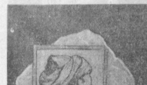
◆ Гозгон мариарига зарб этиган Абу Райҳон Беруний расми.