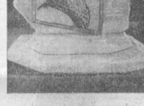
◆ Бронза ва оник мариарига ўнб ишланган Бухородаги Миноран Калон кўриниши.