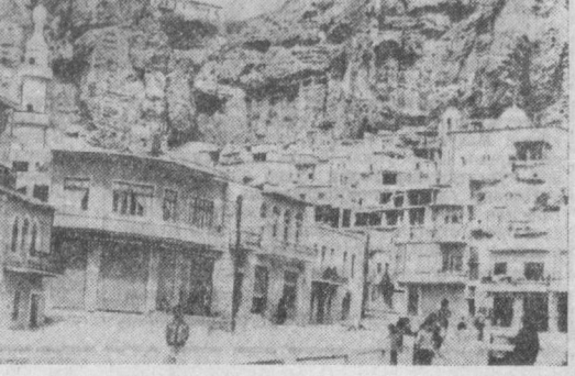
Дамашқ яқинида Суриянинг ақойиб манзилларида бири Маэлюля посёлқаси жойлашган (суратда). Чўқиллар, горулар ва тоғлар ён бағрида жойлашган уйлар ўзига хос амфитеатрнинг ташкил этади. Бу эса кўплаб туристларни ўзига жалоб этмоқда.

Комбинат маҳсулотини кўплаб олтин ва кўмуш медалларга сазовор бўлган. Бу медаллар Франция, Совет Иттифоқи, Италия, Габрий Германия ва Югославиянинг ўзида ўтказилган халқаро конкурсларда олинган. (ТАСС.)