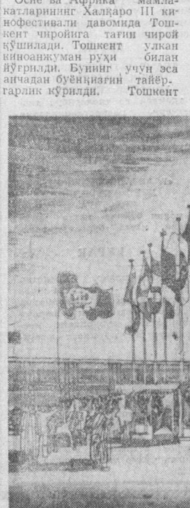
СУРАТДА: Фестивалга тақдим этилган бадний фильмлар намойиш қилинадиган Санъат саройининг байрам қиёфаси рессом мўйқаламида ана шундай ифодаланган.

Осие ва Африка мамлакатларининг Халқаро III кинофестивали давомиде Тошкент чиройига тағин чирой қўшилади. Тошкент улкан киноанжуман руҳи билан йўрилади. Бунинг учун эса анчадан бунённинг тайёр, гарлик кўрилади. Тошкент аэропорти, Санъат саройи, «Тошкент», «Россия» меҳмонхоналари пештоқларида фестивал эмблемалари, мамлакатлар байроқлари, шорлар товланиб турибди. Шунингдек, жойларда ташиқлот этилган кўргазмалар,