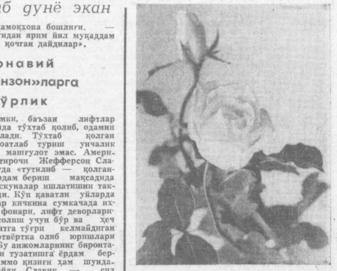
Гул Ҳидидан муаттар диллар. В. Бедоплотов фототўғди. Редактор С. М. ҚАРОМАТОВ.

○ АЖАБ ГУНЁ ЭКАН «Меҳмонлар»нинг миси чиқди Замонавий «Робинзон»ларга ғамхўрлик Маълумки, баъзан лифтлар ярим йўлда тўхтаб қолиб, оданим безор қилади. Тўхтаб қолган лифтда соатлаб туриш унчалик қўнғилили машғулот эмас. Америкалик иختирон Жейферсон Славик лифтга «гунё» қолганларга ёрдам бериш мақсадида махсус ускуналар ишлатилиш таклиф қилди. Қўн қаватли уйларида яшовчилар кичкина сумкада ихчам қўл фонари, лифт деворларига расм солиш учун бўр ва ҳеч қандай винтга тўғри келмайдиган махсус отвёртка олиб юришлари лозим. «Бу анжомларнинг биронтаси лифтни тузатишга ёрдам беради. Аммо қизини ҳам шундайда, — дейди Славик, — сиз лифтни очинга очолмайсиз, лекин нима биландир банд бўлиб, вақтингиз утганини сезмай қоласиз». «Вокруг света»дан.