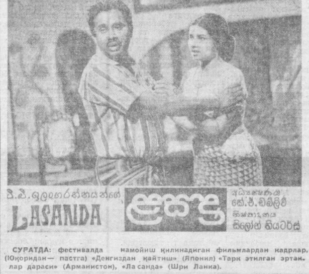
СУРАТДА: Фестивалда намойиш қилинадиган фильмлардан кадрлар. (Югоридан — пастга) «Доғиздан қайтиш» (Япония) «Тарк этилган эртанлар дараеси» (Арманистон), «Ласанда» (Шри Ланка).