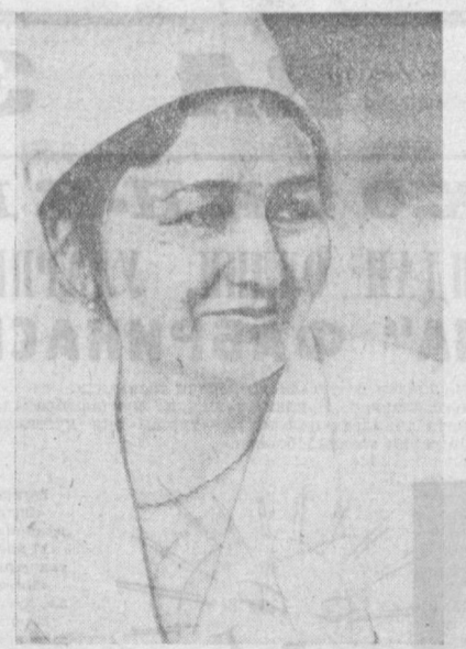
Тошкент илмий фармацевтика заводининг меҳнат ахли мамлакатимиз аҳолиси эҳтиёжини унутиш хил номағли шифобахш дориндорлар ишлаб чиқармоқда.

Илмий медицина информатикаси масалаларига бағишланган Тошкентда ўтказилган биринчи республика илмий конференцияси медицина фахри ва практикасининг йўналишларини пронага қилишга бағишланди. Ўзбекистон ССР Соғлиқни сақлаш вазири К. С. Зоиров республика 50 йил мобайнида соғлиқни сақлашнинг ривожланиши тўғрисида доклад қилди. Конференция ишида Ўзбекистоннинг етакчи олимлари ва мутахассислари, Москва ва бир қанча қардош республикаларнинг медаллари қўйилди. Илмий медицина информатикасини ривожлантириш атувал масалалари, соғлиқни сақлаш илмий хидмати ва медицинадаги информация билан таъминлаш тўғрисида ўтказилган ортқ доклад қилинди. Конференция ишида Ўзбекистоннинг етакчи олимлари ва мутахассислари, Москва ва бир қанча қардош республикаларнинг медаллари қўйилди. Илмий медицина информатикасини ривожлантириш атувал масалалари, соғлиқни сақлаш илмий хидмати ва медицинадаги информация билан таъминлаш тўғрисида ўтказилган ортқ доклад қилинди.