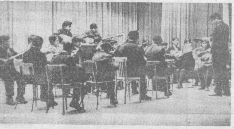
Ленин номи республика пионерлар ва ўқувчилар саройи қошидаги миллий халқ чолғу ансамбли Эзбекистон ССР ва Эзбекистон Компартияси юбилейига бағишлаб катта концерт программаси тайёрламоқда.

Суратда: ансамбль янги куй ижро қилляпти.