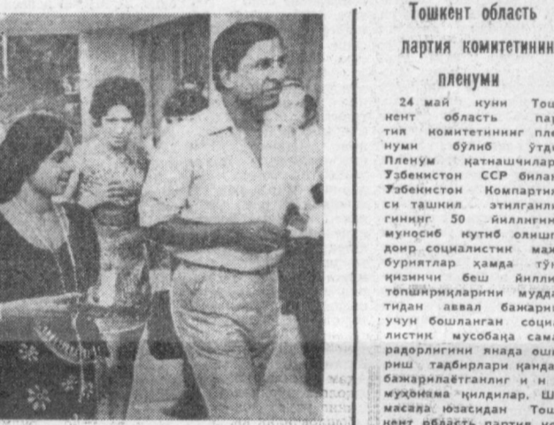
СУРАТДА: Тошкентда ўтаётган Осби ва Африка мамлакатлари III Халқаро кинофестивали иштирокчиларидан бир группаси. Улар навбатдаги конкурс фильмини кўриш учун кетмоқдалар.