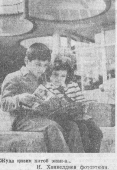
Жуда қизиқ китоб экан...

3-автопарк маъмурияти пассажирларнинг талаб ва эҳтиёжларини сичиллаб ўрганишда. Маршрутлар йўловчилар оқини тўғри ҳисобга олган ҳолда кўйил-моқда. Янгида «Хад-