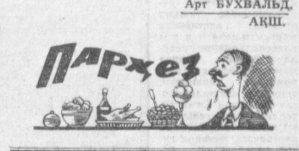
Арт БУХВАЛЬД. АҚШ.

Утган илми ёзда мен врач маслаҳатига кўра озмига қорор қилиб парҳез тутдим. Бу парҳез ойига беш килограмм озиш кафолатини беради. Парҳез бир сиздан ёки қандисиз қаххадан иборат эди. Иккинчи нуношда эса қайнатилган тузсиз гўшт, эллик грамм пишлоқ ёки жиндай қатиқ тановул қилиш керак эди. Тушлик ҳам шундай эди. Тушликнинг ўзиндан иборат. Бунинг устига суткасига ярим литрдан кўп суюқлик ичмаслик талаб қилинарди.