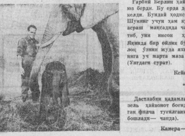
Дастлабки қадамлар. (Швейцариядаги Базель ҳайвонот боғида эндиюна дунёга келган филча тугилганидан 20 минут ўтгач юра бошлади — чапта).

га ердан беришини жуда ишонarli қилиб исботлаб берди. Овқат нормал ҳазм бўлганда ётупланмас экан. Де-ман, жуда соз — мен ажойиб бўғунд аниосидан бир ишаним бў-шатиб ташладим.