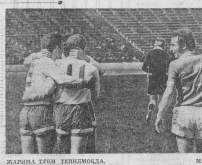
ЖАРИМА ТҶИПИ ТЕПИЛМОҚДА.

ченколар иштирок этишмоқда. Ҳозир ўтган йилги турнир готлиби В. Ковпан — 598 очко билан пешқадамлик қилмоқда. Эриаклардан А. Якобсен — 565 очко билан олдинда борапти.