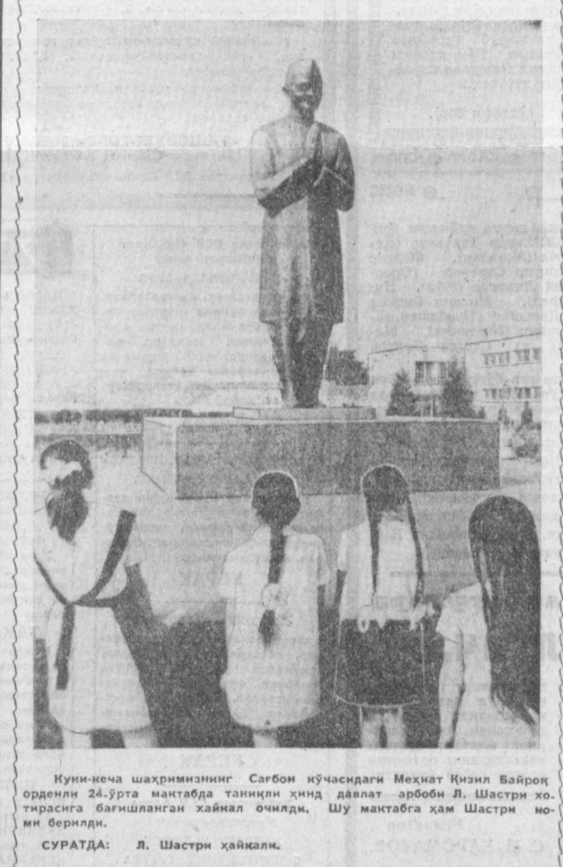
Кўри-кеча шаҳримизнинг Сағбон кўчасидаги Меҳнат Қизил Байроқ ордени 24-урта мактабда таниқли ҳинд давлат арбоби Л. Шастри хотирасига бағишланган ҳайкал очилди. Шу мактабга ҳам Шастри номи берилди.

Чоғроқ бир кунда зардўн дўппилар тўппини қўрасиз. Уларнинг ҳар бири қўғир-чоққа аталгандек кичик қилиб тикланган. Мана, «Товус» гул дўппи. Унинг минг йиллик тарихи бор. «Заминдўн» XIX асрнинг дўпписидир. Номини деҳқончиликка оид бўлсада, уни бойлар кийишган. «Равно» қиз номи билан аталган. «Гулшан» дўпписининг гули эса ҳозирги вақтда, Бухородаги «Октябрь 40 йиллик» номли зардўнлик фабрикасида бунёдга келган. Илгари вақтларда дўппини фақат эркаклар тикларди, энди бўлса бутун фабрикада битта эркакни излаб топши амри маҳол. Ҳозирги зардўн чеварлар бир неча бригада ташкил этишган. Париж, Монреаль, Токио, Дакка, Лейпциг, Дамашқ ва дунёнинг бошқа кўп шаҳарларидаги виставкаларда шухрат қозongan зардўн дўппини кийишга алақачон ҳаммадан кўриб етандиган бўлиб кетди. А. ФОЗИЛОВ, ТАСС мухбири.