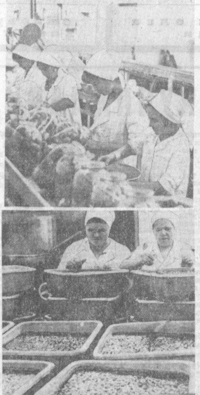
Тошкент консерва заводида пойтахт областининг миришор бобгонлари ва деҳқонлари етиштирган саҳий ёз нематларини қайта ишлаш маҳсуми бошланди. Корхона коллективни қисқа фурсатда 1 миллионга яқин шартли банка қулуп, най, олча, олма, каби мева шарбатлари, консервалар тайёрлади. Ҳозир консерва тайёрлаш кенг қўлама давом этаётти.

Совет ҳукуматининг тақлифига буюндек Покистон Ислам Республикасининг Бош министри З. А. Бхутто шу йил июль ойининг биринчи ярмида расмий визит билан Москвага келади.