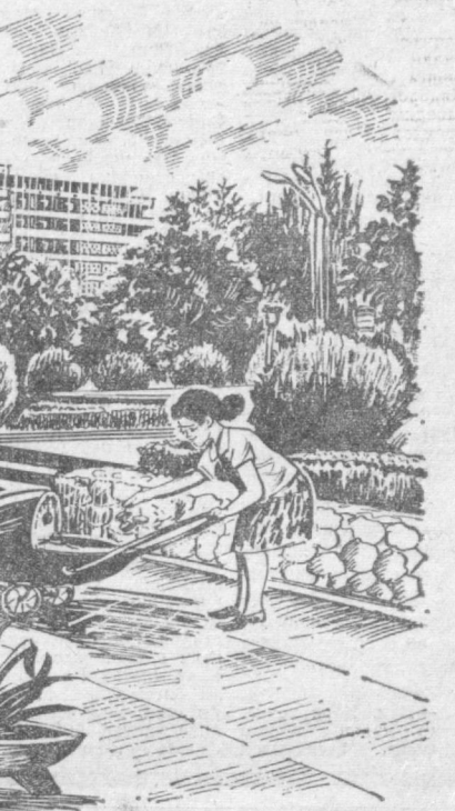
Сулми хибонлар, оромбахш хибонлар! Шаҳримиз хибонлари афсоналарда қулланган эрам боғлардан ҳам фусундор. Рассом Е. ОДИЛОВ чиқарган. Бу расмда Ленин хибони тасвирланган.

Шимоний Америкада яшовчи қурбақа-бўққичларидан товуш 2-3 километрдан эшитилади. М. Аъламова тўплаган.