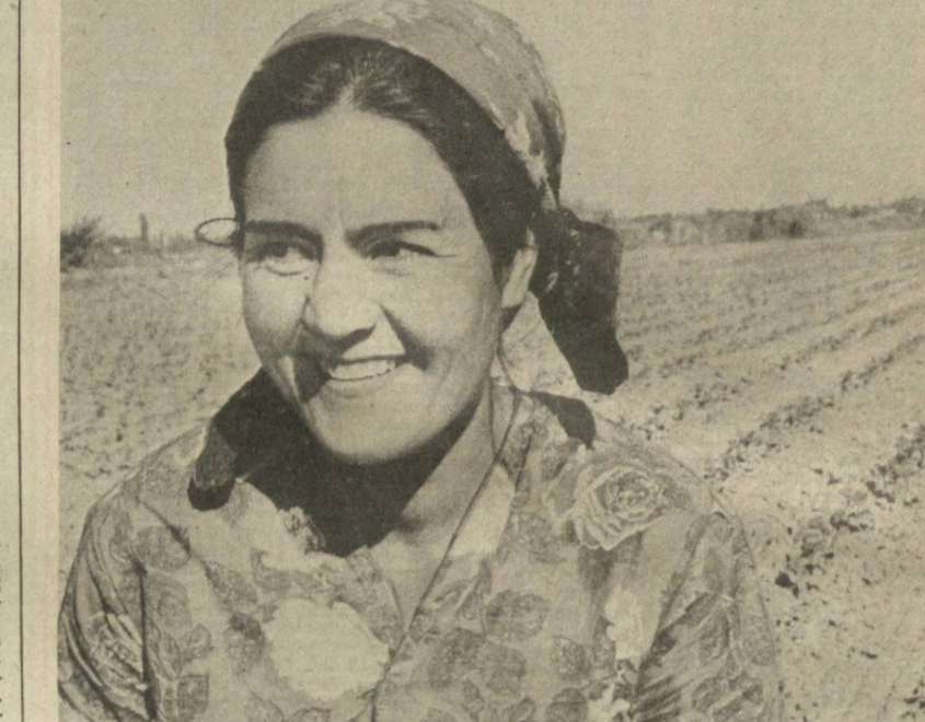
Элиққалъа районидagi Калинин номи колхоз деҳқонлари жорий йилда 1990 гектар майдоннинг ҳар гектаридан 24,5 центнердан пахта етиштиришмоқчи. Хўжаликда онлайин пудрат кенг жорий этилгани тўғрисида тўла гектарлар ҳўсил қилинди. Айни кунларда кўзга қар...

Ўзбекистон Компартияси жумҳурият аҳолиси кўпчилигининг фикрини ифодалаб, бозор иқтисодиётига ўтишга жадаллаштириш зарурлиги тўғрисидаги фикрни бутунлай рад этмади. Аҳолининг ярмини кам таъминланган тоифа ташкил этадиган ва бир миллионга яқин ишсизлар бўлган Ўзбекистон ССР шароитида бозор иқтисодиётига ўтишнинг жадаллаштириш халқнинг турмуш даражаси кескин пасайиб кетишига, иқтисодий-сиёсий ва зиятнинг кескинлашувига олиб бориши мумкин.