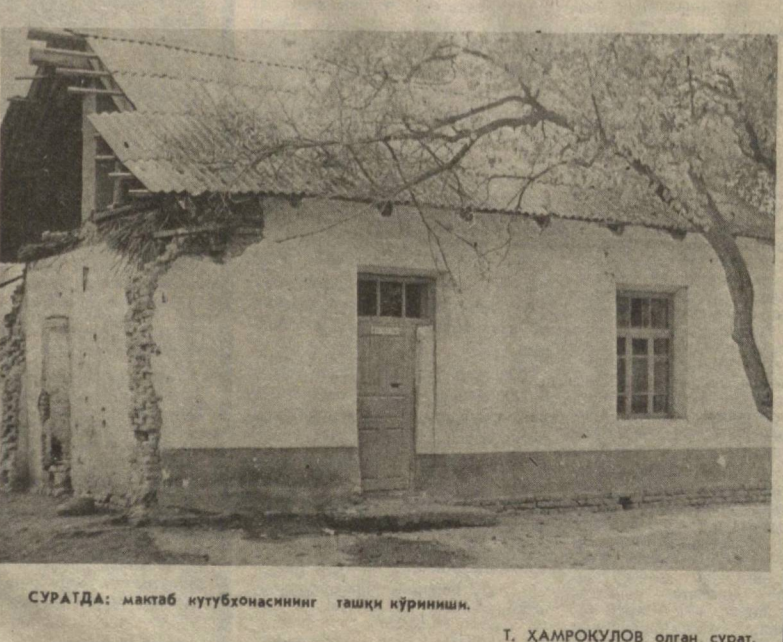
СУРАТДА: мактаб кутубхонасининг ташқи кўриниши.