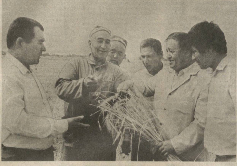
Жумҳуриятимиз галлазорларида ўрми-йиғим жадал бормоқда. Бу юмушга Сурхондарё вилояти деҳқонлари биргаликда қаторида кириштирилди. Беллашувда Термиз, Ангор, Шеробод районлари пеншалмақ қишлоқлар. Денов районидagi Калинин номида қўшнинг бошоқли дон усталари эса экинларидagi мажбуриятни адо этдилар.