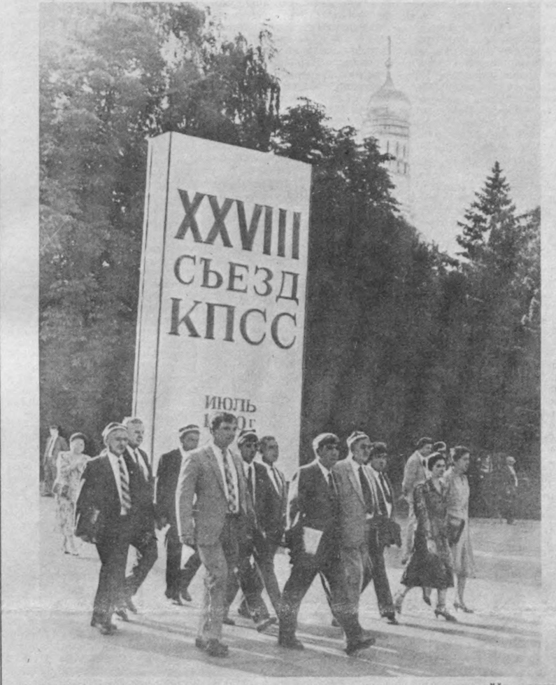
МОСКВА. Ўзбекистонлик делегатлар съезднинг мажлислар залига йўл олмоқдалар.