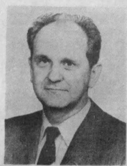
Пленумида КПСС Марказий Комитети ҳузуридаги Партия назорати комитетининг раиси этиб тасдиқланган.

1984 йилдан — Латвия Компартияси Марказий Комитетининг биринчи котиби, КПСС Марказий Комитетининг 1988 йил сентябрь