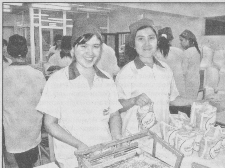
ЙОДЛАНГАН ОШ ТУЗИ ФАҚАТГИНА ТАОМГА МАЗА КИРИТИБГИНА ҚОЛМАЙ, БАЛКИ ҲАР БИР ИНСОМ САЛОМАТЛИГИДА ҲАМ МУҲИМ ҲИСОБИ ТУТДИ. АЙНИҚСА, БУҚОҚ КАСАЛЛИГИНИНГ ОЛДИНИ ОЛИШДА УНИНГ АҲАМИЯТИ БЕКИЁСДИР.

Шаҳримизда фаолият кўрсатаётган «Орзу-ош тузи» шўба корхонасида маҳаллий хом ашёдан юксак унумли технологик линиялар қувватидан самарали фойдаланиб тайёрланаётган ош тузининг ҳам сифатига, йодланган даражасига, қадокланишига алоҳида эътибор қаратилади. Шу боис бўлса керак, ушбу савдо белгиси билан ишлаб чиқарилаётган махсулотнинг харидорлари сафи ортиб бормоқда.