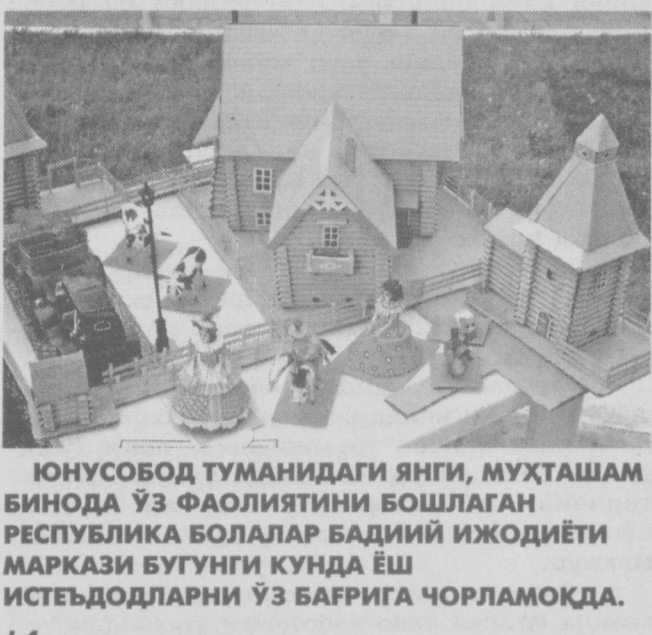
ЮНУСОБОД ТУМАНИДАГИ ЯНГИ, МУҲТАШАМ БИНОДА ЎЗ ФАОЛИЯТИНИ БОШЛАГАН РЕСПУБЛИКА БОЛАЛАР БАДИЙ ИЖОДИЁТИ МАРКАЗИ БУГУНГИ КУНДА ЁШ ИСТЕЪДОДЛАРНИ ЎЗ БАҒРИГА ЧОРЛАМОҚДА.