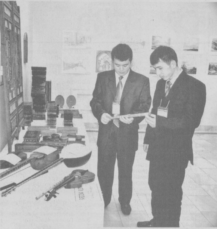
«Келажак овози — 2007»