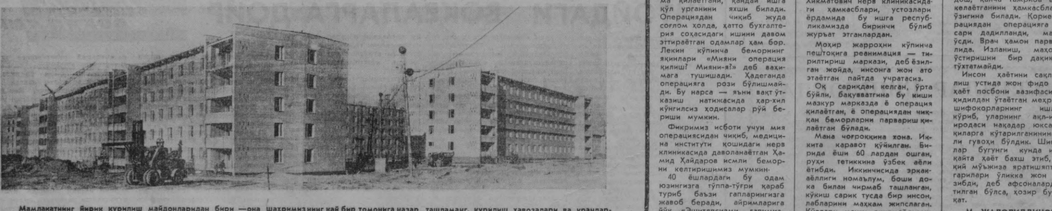
Мамлакатнинг янги қурилиш майдонларидан бири — она шахримизнинг қай бир томонига назар ташламанг, қурилиш ҳавозалари ва кранлар...