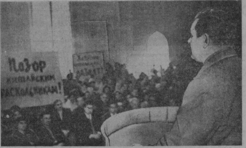
Тошкент аҳолиси хитойлик бузғунчиларни ланглатмоқда. Шаҳарнинг кўпгина норхона ва муассасаларида норозилик митинглари бўлиб ўтмоқда.

ев. Д. Норбулатов фр-тоқлар институт ўқитувчиси Ашуров раҳбарлигида «Зарафшон» маҳалласи аҳолиси ўртасида шу кунларда ҳар томонлама тушунтириш ишлари олиб бормоқдалар.