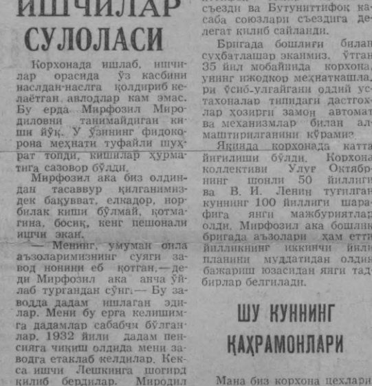
Матлўм бўлишича, Мирфозил ака биз олдинда тасаввур қилганимиздек бақувват, елкадор, норбиллак киши бўлмади, қотмагина, босиқ, нег пешонали ишчи экан.