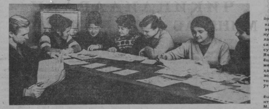
НАМУНАЛИ АГИТПУНКТДА. Поётмахтин Ленин районидagi 8-сайлов участкаси қошида ташкил этилган агитпункт. Шу кунларда намунали ишлар амалга ошди. 60 агитатор сайловчилар ўртасида суҳбатлар ўтказмоқда. Янгида бу агитпунктда ёш сайловчиларнинг меҳнат ветеранлари ҳамда депутатликка номзоди кўрсатилган ўртоқлар билан уррашуви ўтказилди.