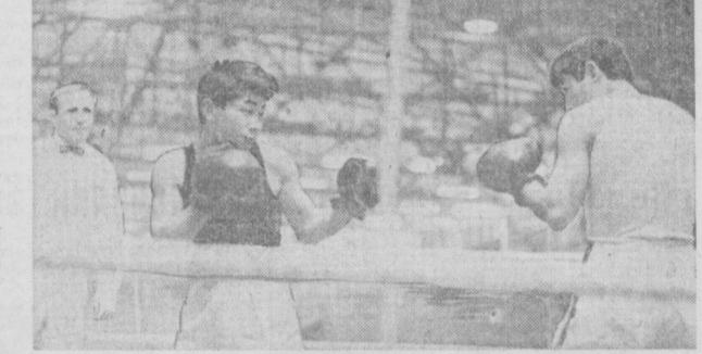
«Ешлик» спорт манажментининг маълумоти билан, «Ешлик» спорт манажментининг маълумоти билан, «Ешлик» спорт манажментининг маълумоти билан...