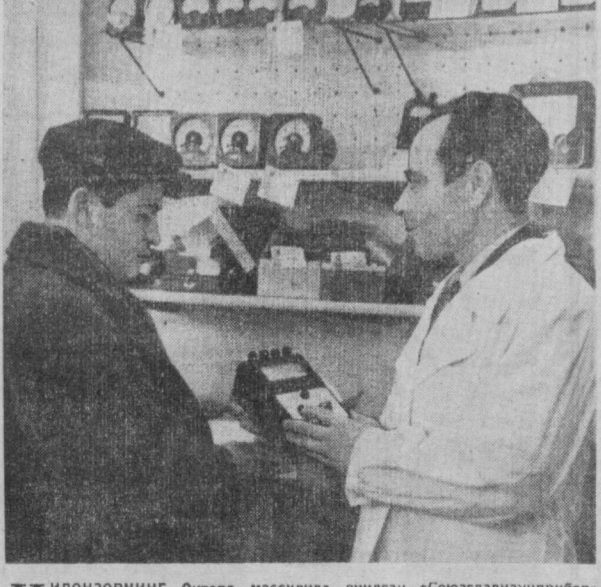
ЧИЛОНЗОРНИНГ Оқтепа массивида очилган «Союзглавнаучприбор» Бутуниттифон бирлашмасининг махсус салон-мағазини ишга тушга-нига кўп бўлгани йў. Лекин ана шу иссиқ мудат ичида бу мага-зиннинг хизматидан нўнгина илмий-тежирини ташкилотлари ва олий ўқув юрталари фойдаланишлар. Приборлар салон-мағазини радио-электрон-техникаси, турли хил ўқув ва лаборатория асбоб-ускуналари, приборла-ри улгури ва чаман нархлар билан сотилади.