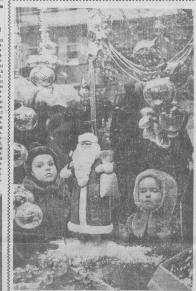
Москвада болаларнинг янги йил байрами учун кенг асортиментда арча безаклари сотила бошлади. СУРАТДА: «Болалар дунёси» универсал магазиннинг арча ўйинчоқлари ёнида.