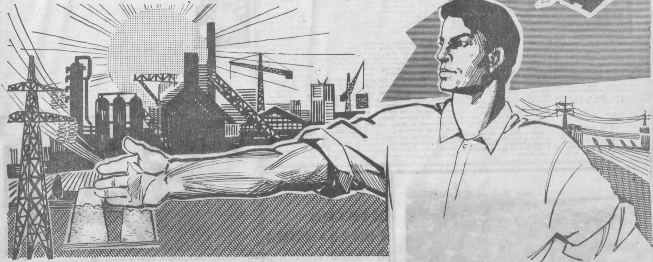
Рисом З. Лелявская чизган плакат.