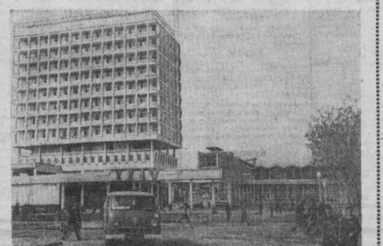
Студентлар шаҳарчасининг бугунги жамоли. СУРАТДА: В. И. Ленин номи Тошкент Давлат университети.

Бобом ҳақ гапни айтдилар. Азим шаҳримиз беш йил ичда қаддини ростлаб олди. Шимолда Шерк, Високовольт, Янги эбод, Бешқайрағоч, Қорақоғил мачсиллари, бир неча Марказ турар-жойлар, Чилонзорда қардошлар бунёд этган қўлдан қўл кварталлар шаҳримиз кўр