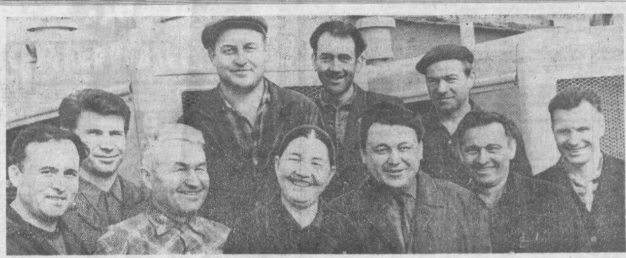
Шаҳримиздаги «Компрессор» заводининг маънавиятлари шовли КПСС XXIV съездининг меҳнатда катта зафарлар билан кутиб олдилар. Улар квартал плани муддатидан илгари бажариб, бир неча юз минг сумлик маҳсулот ишлаб чиқаришга аҳд қилдилар. Шу кунларда корхона ишчи ва хизматчилари кўшимча мажбуриятни ҳам муваффақиятли адо этиш учун жонбозлик кўрсатмоқда.

Юбилей йилнинг ўзига шаҳримизда иқтисослаштирилган болалар поликлиникалари ишга тушди. Замонавий медицина леб-анжомлари билан таъминланган янги очилган иқтисодиёти аҳолига намунали хизмат кўрсатмоқда.