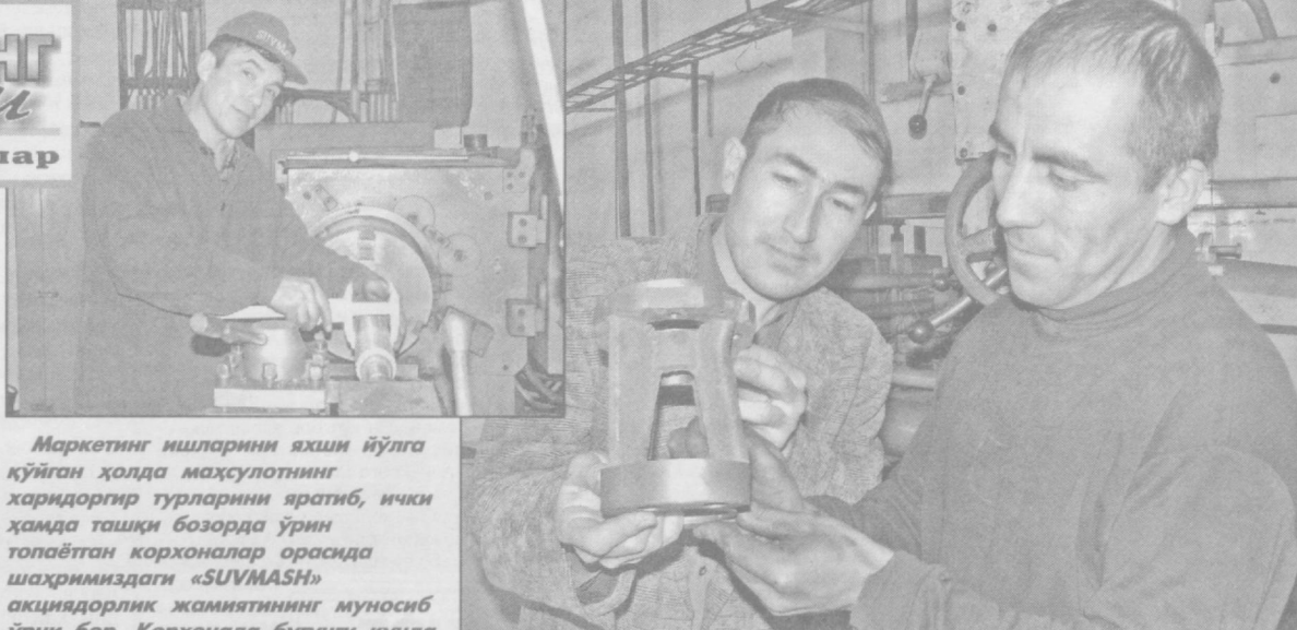
Маркетинг ишларини яхши йўлга қўйган ҳолда маҳсулотнинг харидориги турларини яратиб, ички ҳамда ташқи бозорда ўрин топаётган корхоналар орасида шаҳримиздаги «SUVMASH» акциядорлик жамиятининг муносиб ўрни бор. Корхонада бугунги кунда бозор иқтисодиёти талабларига кўра барча имкониятлардан фойдаланиб иш юритилаётгани боис ҳам иш суръати ва маҳсулот сифати ортиб бормоқда.

(Тошкент шаҳар ҳокимлигининг Ахборот хизмати ва ўз мухбирларимиз хабарларидан).