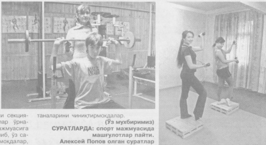
таналарини чиниқтирмоқдалар. (Ўз мухбиримиз) СУРАТЛАРДА: спорт мажмуасида машғулотлар пайти.

бу ерда ёшларнинг бўш вақтларини кўнгилли ўтказиш ва саломатликларини мустаҳкамлашда ўзига хос омил вазифасини ўтовчи атлетизм, аэробика, шейпинг, шахмат, стол теннис секциялари очилди, турли тренажёрлар ўрнатилди. Ҳозир ушбу спорт мажмуасига узок-яқиндан кўлаб ёшлар келиб, ўз саломатликларини мустаҳкамламоқдалар,