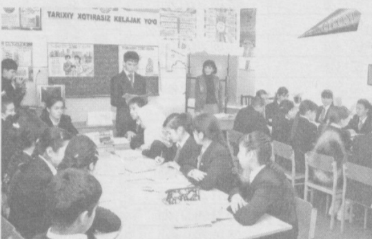
Жумладан, Учтепа туманида жойлашган «Ором» болалар мактаб-марказида ҳам жорий йил боши-

МАМЛАКАТИМИЗДА КАДРЛАР ТАЙЁРЛАШ МИЛЛИЙ ДАСТУРИДА БЕЛГИЛАНГАН ВАЗИФАЛАР ИЖРОСИНИ ТАЪМИНЛАШ МАҚСАДИДА ЎҚУВ МАСКАНЛАРИДА ТАЪЛИМ СИФАТИ ВА САМАРАДОРЛИГИНИ ОШИРИШГА АЛОҲИДА ЭЪТИБОР ҚАРАТИЛМОҚДА. ЎҚУВЧИЛАРНИНГ БИЛИМИНИ ОШИРИШ МАҚСАДИДА ФАН ОЙЛИКЛАРИНИ МУНТАЗАМ РАВИШДА ЎТКАЗИШ АНЪАНАГА АЙЛАНГАН.