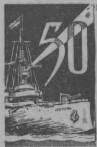
ПЕТРОГРАД. 1917 йил. Қишки саройга ҳужум.