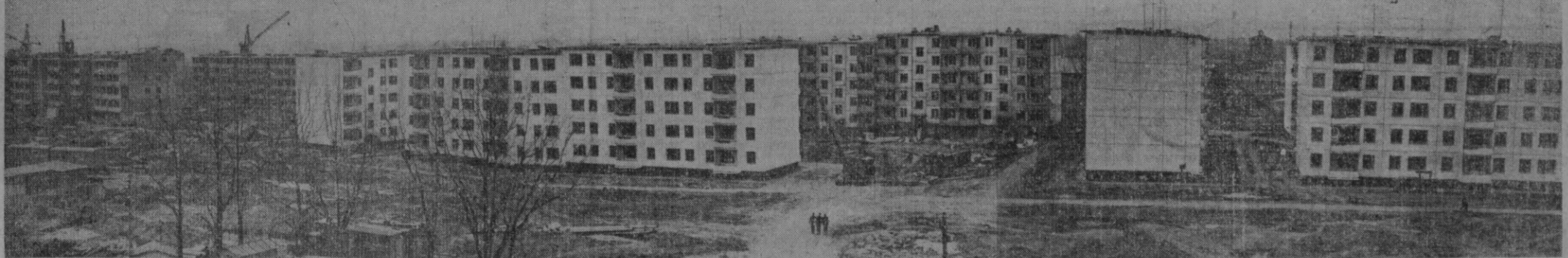
Високовольтиный массивининг Черданцев номли кўчасида 1690 оилга мўлжалланган кўп қаватли уй-жой бинолари қўрилмиш тез суратлар билан олтиб бориламоқда. Бу Зиноларин «Главташкентстрой» Зинокорлари барпо этмоқдалар. Суратда: қудлиши ишлари тугалланган биноларни кўриб турибсиз. Бу уйларнинг қалъалари яқинда ҳамшаҳарларимизга топширилади.

МЕҲНАТКАШЛАР ДЕПУТАТЛАРИ ТОШКЕНТ ШАҲАР СОВЕТИНИНГ XI ЧАҚИРИҚ I СЕССИЯСИНИНГ МАНДАТ КОМИССИЯСИ ДОК-ЛАДИ ЮЗАСИДАН ҚАРОРИ Меҳнаткашлар депутатлари шаҳар Совети-нинг мандат комиссиясининг докладини аши-либ, сессия қарор қилди: 1. Ўзбекистон ССР меҳнаткашлар депутатла-ри шаҳар Советлари тўғрисидаги Низомга би-нован, мандат комиссияси томонидан топши-рилган ҳужжатларга асосан 479 сайлов оқ-ругида сайланган депутатларнинг ваколат-лари тўғри деб топилин. 2. Меҳнаткашлар депутатлари Тошкент ша-ҳар Советига сайлов ўтказувчи шаҳар сай-лов комиссиясининг бурчи тугалланган деб ҳисоблансин.