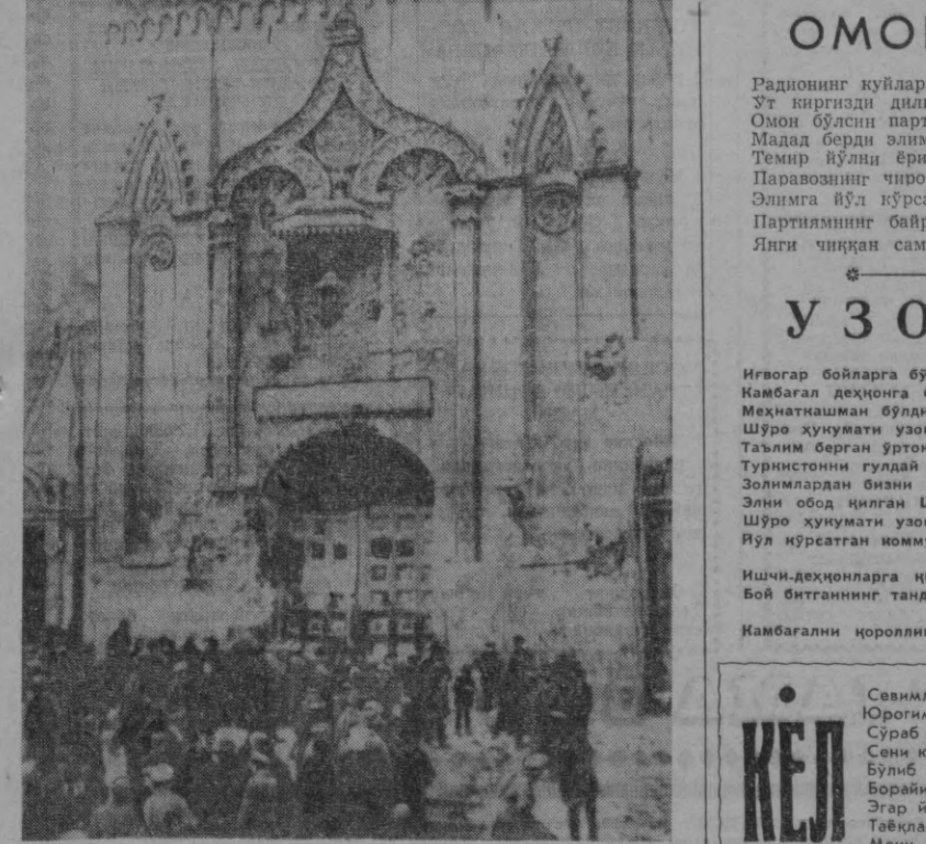
1917 йил, НОЯБРЬ. Кремль олдинди. Никольский дарвозаси ёнида. [СССР Давлат революция музей фондидан].

Барча элга нур бўлган улуг дохий Лениндир, Ҳуқуқларни тенг қилган улуг дохий Лениндир, Ватанимни гул қилган улуг дохий Лениндир, Тоғу тошин дур қилган улуг дохий Лениндир, Элни йўлга бошлаган улуг дохий Лениндир, Душман кўзини ёшлаган улуг дохий Лениндир, Мақтаб юзини кўрсатган улуг дохий Лениндир, Ош-нонимиз мўл этган улуг дохий Лениндир, Саодатга йўл этган улуг дохий Лениндир, Уйимизни нур этган улуг дохий Лениндир, Партияни яратган улуг дохий Лениндир, Зулматга ёғду сочган улуг дохий Лениндир, Меҳнаткаша бахтин очган улуг дохий Лениндир, Бахт йўлини ўргатган улуг дохий Лениндир, Ленин йўли йўл бўлиб, мамлакатда тонг отди, Ленин йўлидан бордик, Ватан хушбўй таратди, Ленин йўлидан яна, яна олға борамиз, Ленин тузган партия душман тахтин қулатди, Ленин тузган партия бизни бахтаг чорлайди, Партия иши билан ҳар дам юрак порлайди, Ватанга содиқ кимки, партия олқинлайди, Чунки Ватан, бу Ватан — улуг дохий Лениндир! Холдон ЖУМАНОВА.