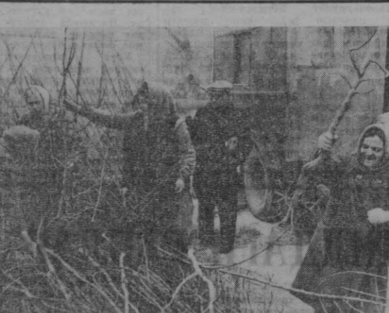
Революция ҳибониди гул нўчат магазини шу кунларда шахар аҳолисига қўлаб сифати мева ниҳолларини сотмоқда. Бу мева ниҳол-лари республикамиз ва қардош ишчи республикалар нўчат хўжалик-ларида етиштирилган. СУРАТДА: мева ниҳоллари савдоси лойти.

рнинг ҳар бирини ёддан билиши, қайсиси қаерда турлиш, бунилас тўзатиш йўллари асла димки! Аммо Флора билан Зулайхо ҳаммасини беш кўнден билиб олинган. Трубкадаги овозга қараб қайси ли-ния қандай ишлайтгани-ни, линиянинг қайси жойида бузилиш бўлга-нини дарров айтиб бе-ришати. Уа қасбига бўлган катта муҳаббат, техниккага бўлган ҳавас бу икки қизга куч-гай-рат бағишлайди. Шу-нинг учун ҳам улар чарчашини билмайди, шунинг учун ҳам тиним билмай ўрганишди. Чиндан ҳам бу дуго-налар АТСнинг ҳамма инсир-чинларини би-ди олишган, ҳар қан-дай ишни кўнгидаги-дек адо этишати. Флора