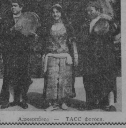
ТУНИС. Рақослар.