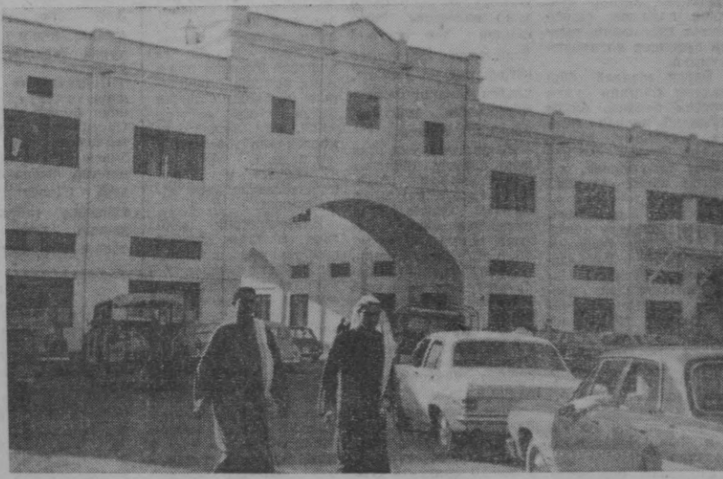
Пойтахтнинг энг асосий майдони «Бахрей» ўзбек тилида «Бахрей» деган маънони билдиради. Бу ер маманингу амалдорлар жойлашган марказидир. Бу майдонда йирик давлат муассасалари ва савдо банислари жойлашган, (юқоридеги сурат).

маълумдир. У Сибирнинг бошқа бирорта шаҳрига ўхшамайди. Мен Московски дега бғоч кесувчидаан (мен у билан танишиб олдим) келми учун Сибирга индимиз» деб сўрадим. — Мен шу ерда тутилганман, — деб тунтирдди у. — Эҳтимол, сизга ҳам Сибирь жуда ёқиб қолгандир. — Мен бу ерда ажойиб кишиларни учратдим, — деб жавоб бердим. — Бу сизнинг саволингизга яна бир жавоб. Шу сабабли биз Сибирда яшаймиз. Дин Конгер ўз материалда қийинчиликлар ва хатарлар тўғрисида ёзди. Лекин мақоланингу умумий маъмуни, хулосаси, жуда яхши фотографиси бўлгани Сибирнинг ҳақиқий манзарасини чиқиб беради. (АПН).