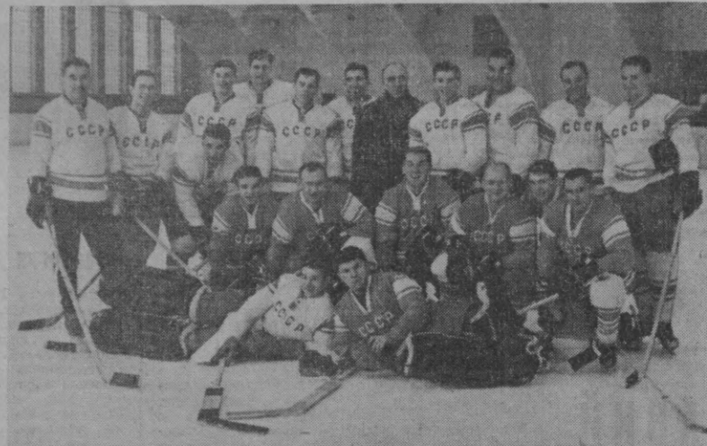
СССР хоккей терма командаси Вена шаҳрида ўтаётган жаҳон чемпионатида муваффақиятли катнашмоқда.

«Экран» (Ленинград) — (Свердловск) — 1:3, «Спар-