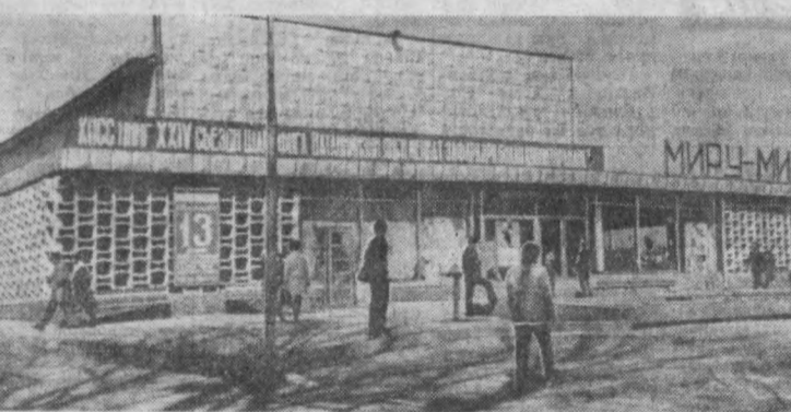
Тошкент трактор заводининг маданий саройи меҳнатқиларга намунаган хизмат кўрсатаётган маданий даргоҳларидан биридир.