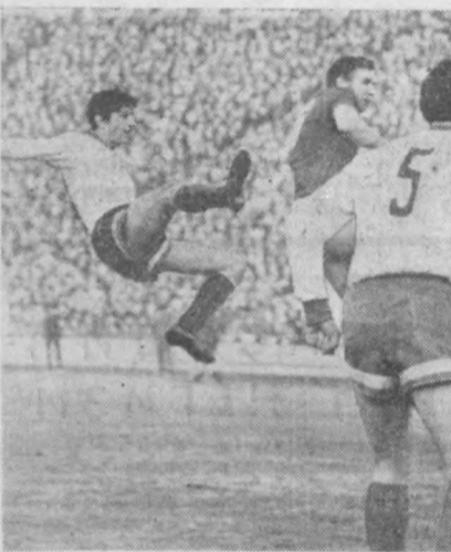
Қийин вазият...

Ўтган йили тошкентлик ишқибозларнинг омади келди. Улар ўз шаҳарларида СССР чемпионлигини аниқлаш учун ўтказилган иккинчи кўрашда «Пахтакор» билан беллашди. Ўтган йилиги билан ҳам футбол ишқибозларини чиройли ўйналарини билан мамнун қилмоқчи. «Агар чемпион бўлсан, биз бунга ўн биринчи марта эришган бўламиз. Лекин Европа кубоги мусобақаларида муваффақиятли қатнашсан олсан, бундан бошимиз осмонга етган бўлур эди. Чунки, бу мусобақада жуда кучли командалар иштирок этади. Хуллас, мақсадимиз ягона. У ҳам бўлса ишқибозларни хурсанд қилиш дейишмоқда команда аъзолари».