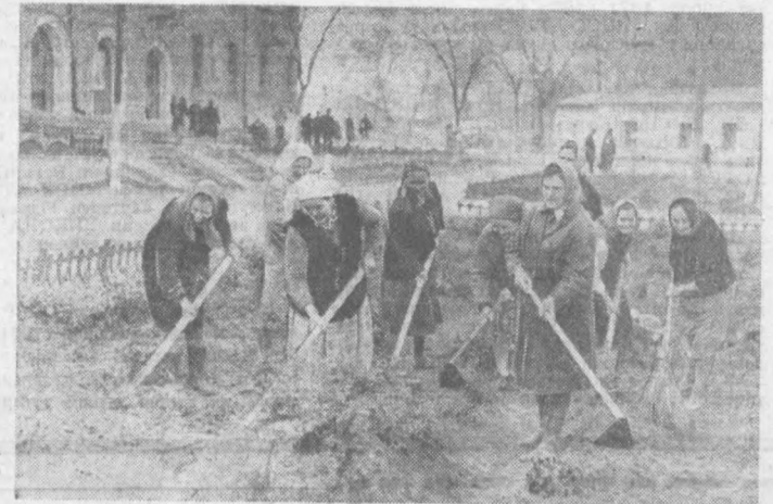
СУРАТДА: бўлимининг бир гурупа хизматчилари иш устида.

рини гўзаллаштиришда бир қатор ибратли ишларни амалга оширишди.