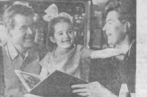
«Союз-9» қосмик қорбднинг командири А. Г. Николаев ва В. В. Николаева—Терешковалар қизлари

Соат ўн бирда дарё бўйидаги павилонда парвоз раҳбарларининг космонавтлар билан уршуви бўлди. Уршуви бош конструктор С. П. Королёвнинг нутқи билан бошланди. Гагарин, Титов ҳам гапирди. Улар ишонч учун аминдорлик билдиришди, биринчи парвознинг муваффақият қозонишига қатъий ишонч билдиришди ва қосмосга кейин бўладиган анча мураккаб парвозлар ҳақида кўзича билан гапирди.