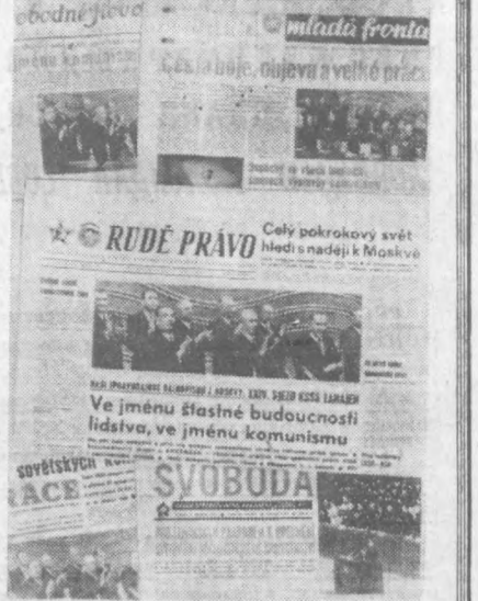
СУРАТДА: Чехословакия газеталарининг биринчи саҳифасида чиққан КПСС XXIV сўзсиз материаллари.