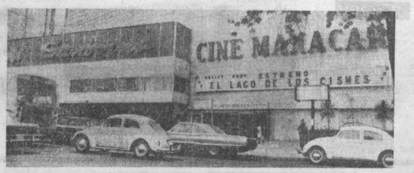
МEXИКО. Мейсика пойтахтининг энг ашдики «Манакерда» «Кўк» кўли кенг форумини, совет филми муваффақият билан намойиш қилинмоқда.

«Манакерда» «Кўк» кўли кенг форумини, совет филми муваффақият билан намойиш қилинмоқда.