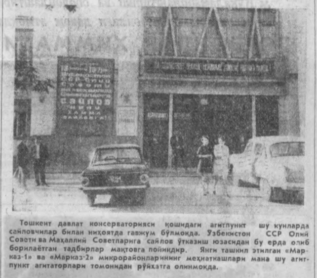
Тошкент давлат консерваторияси қошдаги агитпункт шу кунларда сайловчилар билан илҳовда гапмуқ бўлмоқда. Ўзбекистон ССР Олий Совети ва Маҳаллий Советларига сайлов ўтказиш юзасидан бу ерда олиб борилаётган тадбирлар мақтоғига пойнидир. Янги ташкил этилган «Марказ-1» ва «Марказ-2» микрорайонларнинг меҳнаткашлари мана шу агитпункт агитаторлари томонидан рўяхатга олинмоқда.

«Юбилей» Марказий спорт саройида 3-треста Оснбда биринчи марта машқларни бажариладиган фигуралар учуши мактаби очилди. Қабул имтиҳонлари пайтида болалар яхмалак залда турли хил машқларни бажариладиган мактабнинг ўқувчилари пардаларига жўр бўдилар. Фигуралар учуши мактаби учун Ватанимизнинг пойтахти Москва, Ленинград ваби бир қатор шаҳарлардан маълумат ўқитувчилар талфиб қилинган.