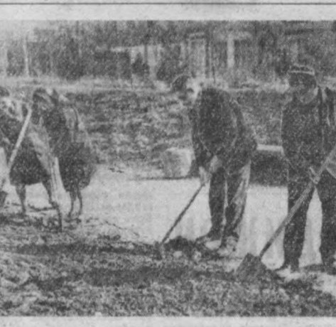
Шаҳримизда кўкаламзорлаштириш ва ободонлаштириш, санитария икки ойлиги муваффақиятли ўтмоқда. Утган шанба ва яшанба кунлари Киров районининг меҳнатқашлари ҳам бу ишга ўз ҳиссаларини қўшдилар. Райондаги абразна комбинати, аббоссоқлик заводи, «Победа» паркида анчагина ободончилик ишлари амалга оширилди.

ТОШКЕНТ кўчатчилик совхозининг ишчи-хизматчилари шаҳримизни ободонлаштиришда кўкаламзорлаштиришда иборат ишлар қилдилар. Икки ойларига, кўча бўйларига, хиёбонларга турди хил мева кўчатлари, атиргул кўчатлари, жузунчалар. Шу кунгача 480 минг туپ олма, олхўри, беҳи, ўрик, олча, ёноғ, кўчатлари сотиб, бу соҳа бўйича йиллик планини ошириб адо этдилар.