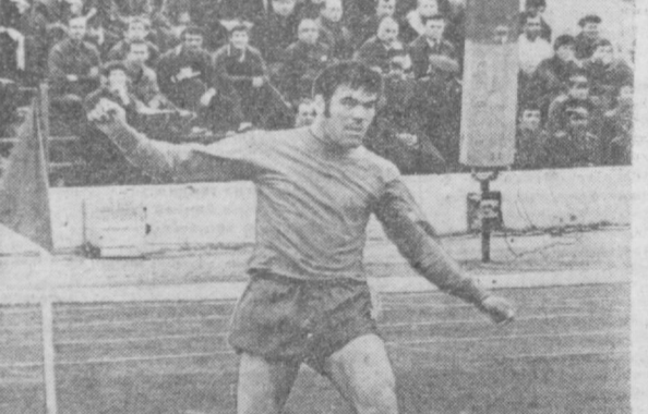
СУРАТДА: бурчакдан тўп тепилди.

Олмаотда Бутунитторқ ёшлар ўйинлари программаси бўйича ўтказилган классик кураш мусобақаларининг натижаси етиди. Команда ҳисобида Грузия спортчилари биринчи ўринни эгаллашди. Мусобақада иштирок этган республикалик вакиллари шахсий ҳисобида бирорта ҳам галаба қозона олганлари йўқ. Команда ҳисобида Узбекистон коллективи Ленинград, Тошкент, Қирғизистон, Литва ва Молдавия номандаларини орда қолдириб, 12-ўринни эгаллади.