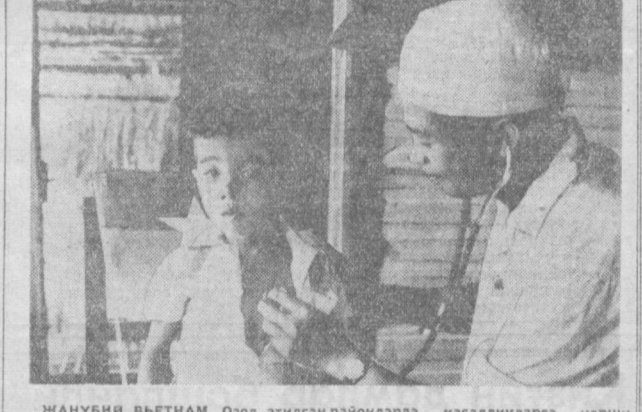
ЖАНУБИЯ ВЬЕТНАМ. Озод этилган районларда касалликларга қарши кураш бўйича тадбирлар белгиланган ти, логм шифохоналар, фельдшерлик пунктлари ташкил этилган ти, медицина на хидимлари сони кўпайтирилган ти.

БУДАПЕШТ. (ТАСС). Бу ерда чоршанба кунин Я. Кадар раислигида Венгрия Социалистик ишчи партияси Марказий Комитетининг пленуми бўлиб ўтди. Пленум актуал ташқи сиёсий масалалар тўғрисида Венгрия Социалистик ишчи партияси Марказий Комитетининг секретари Р. Мьерш қилган ҳисоботини муҳокама қилиб ўтди. Пленум Венгрия Социалистик ишчи партияси Марказий Комитети Сиёсий бюросининг халқ хўжалиги партия ва давлат раҳбарлигини тақомиллаштириш тўғрисидаги тақрипларини муҳокама этди ва қабул қилди.