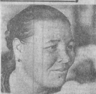
Тамриба пилланашлик фабрикасининг ишчи-лари беш йилликнинг зарбдор учинчи йили топ-шириларини фидокорли билан бажармоқдалар.

Тошкент политехника институтини Поляна Ҳақ Республикасининг Поляна шах-ридаги политехника институтини ва кардош шаҳарнинг илмий-тадқиқот муассасаларида амалий машғулотлар ўтказишди.