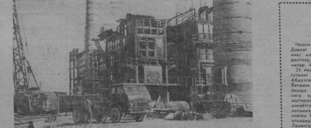
Пойтахтнинг Чуқурсой массивида қуриладиган иссиқлик берувчи бугхонанинг иккинчи навабт қурилиши жадал суратлар билан давом этмоқда, Ҳозир ҳар бири соатига 25 тоннадан иссиқлик берувчи яна икки юзон монтаж қилина бошланди. Бундан илгари фойдаланишга топширилган иккинчи юзон эса ўзсўзлий комбинати, ёғочсозлик комбинати ҳамда Қорақамшидаги турар юйларни иссиқ буг билан таъминлаётди. Суратда: бугхонанинг иккинчи навабт қурилишида.