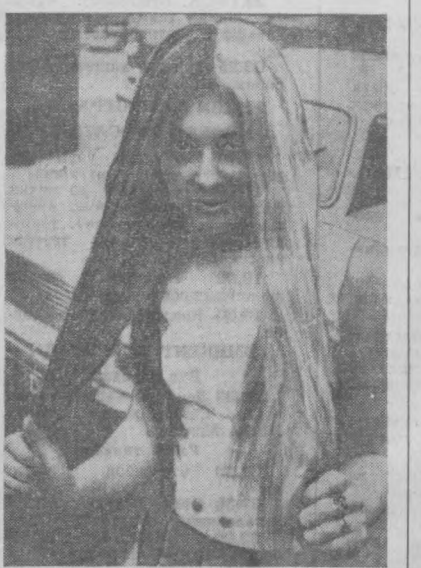
Нималар мода бўлмайди дейсиз... Ҳарбадги айрим моданларнинг айтишига қараганда, 1967 йилда соқин турли хил ранга бўяб юрши модага кирармиш. Сиз бу суратда Италия актрисаси Анна Мария Диллмоттини ўзининг соқини яшил ва сариқ рангларга бўяб олган ҳолда кўриб турибсиз.

портларида йилнинг ҳамма вақтида АҚШнинг юлдузли йўл-йўл олабайроғи тикилган океан кемаларини кўриш мумкин. Уларнинг юк ортиладиган жойларига қимматли хом ашёлар юкланмоқда. Бу хом ашёлар Жанубий Кореянинг ер остидан қазиб чиқарилган вольфрам ва марганец рудалари ҳамда графит ва рангли металллардир. Бу хом ашёлар океан нарғига Сулда кенг реклама қилинган «аввал экспорт» деган шир остида табиб кетилган. Сул режими чет эл валютасини олиш учун Кўшма Штатлар, Япония ва бошқа капиталистик мамлакатларга қазиб чиқарилган 90 фоли қазилмаларнинг 90 процентдан кўпрогини аризмаган баҳога сотиб юборган. Масалан, вольфрам ва марганец рудалари графит Кўшма Штатларга жакон нархларидан 40, 75 ва 70 процент пастроқ нархда сотилади. АҚШдан келтирилётган қишлоқ хўжалик