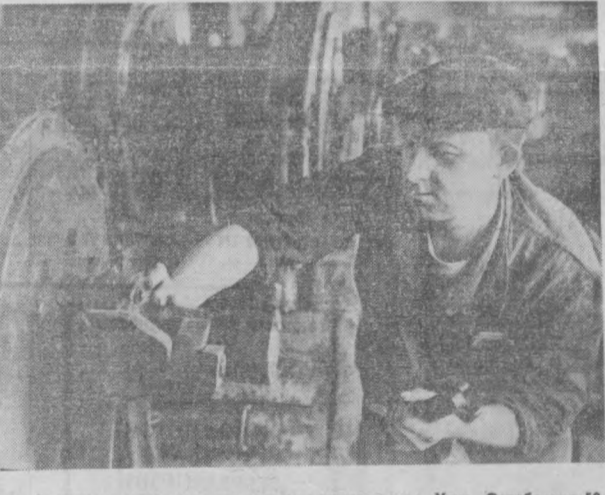
Тошкент ремонт-механика заводи ишчилари ҳам Улуғ Октябрнинг 50 йиллик шарафига шахсий маъбурият олиб ишлашмоқда.