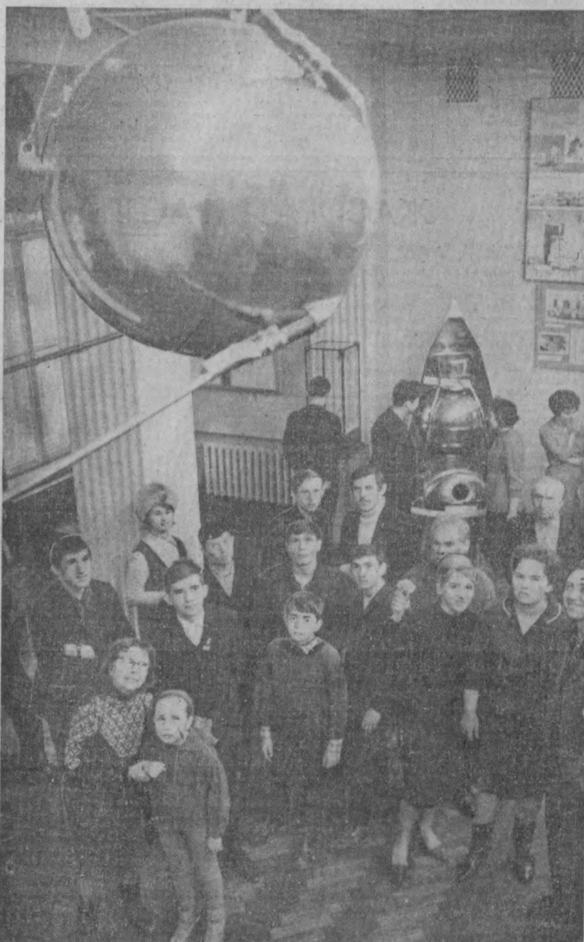
Москва, СССР Революция музейида космонавтлар куни байрами арафасида совет кишиларининг космос фазога ўзлаштиришдаги жасоратлари акс эттирилган эълда томошбинлар хар қачонгидан гафлони. Суратде: томошбинлар Совет сунъий ер йўдошларининг моделларини кўздан кеирмоқдалар.