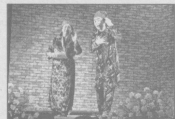
га умид қиламиз.

тисолини яратишга ҳаракат қилдилар. — Жамиятда аёллар ўрнининг кучайтирилиши — тараққиёт ва ижтимоий ҳимояга муҳтож қатламларнинг камайишига асосидир. Жамият ҳаётида муҳим роль ўйнаётган аёллар оила ва умуман миллат саломатлиги ва самардорлиги ҳамда авлодлар келажагининг порлоқ бўлишида катта ҳисса қўшаётдилар. Гендер тенглигининг яна бир муҳим жиҳати — унинг минг йиллик ривожланиш мақсадларининг асосий қисми эканлигидадир, — дея эътироф этди БМТ тизимининг Ўзбекистондаги доимий вакили Анита Нироди хоним. — Олдинги лойиҳаларимиз ва мазкур медиа-компания муваффақиятига асосланиб, ушбу масала мавзусини кенг ёритиш ва гендер масаласи юзасидан жамоатчилик фикрини шакллантиришда бундан бунён ҳам асосий шерикларимиз ва муҳими, ОАВ билан ҳамкорликни давом эттириш-