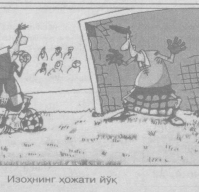
Изоҳнинг ҳолати йўқ