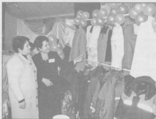
«Ташаббус — 2009»